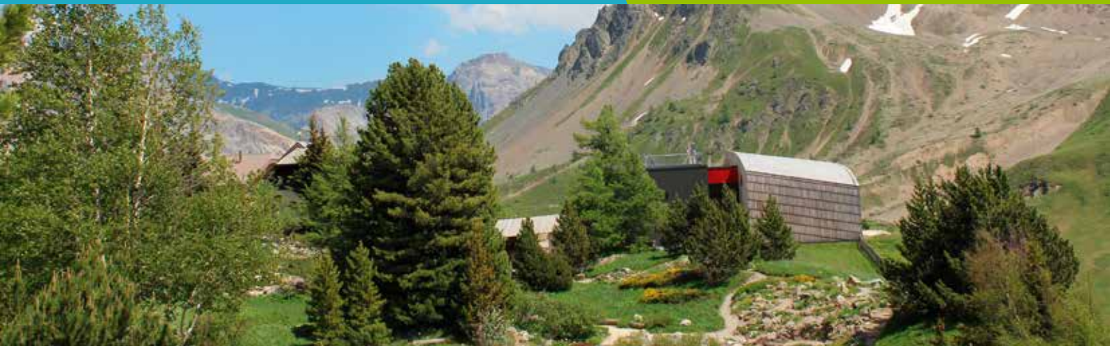
Galerie de l'Alpe au Col du Lautaret à Villar d'Arène (05)