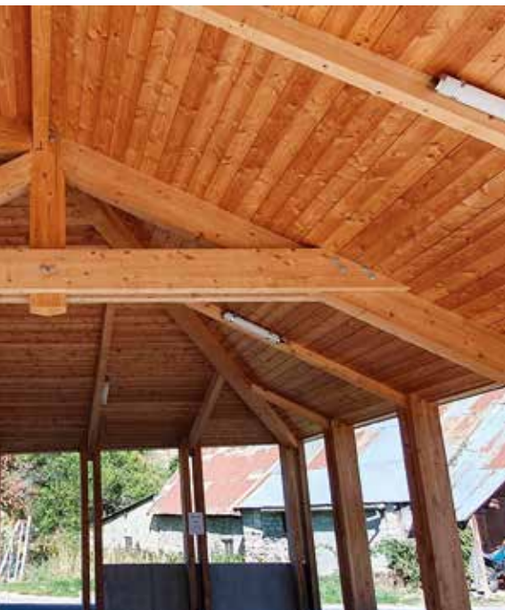
Salle multi-activités de Saint-Apollinaire (05)