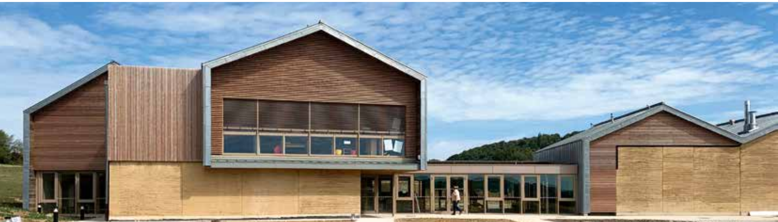
Groupe scolaire de Miribel (26) - Crédit photo : Adrien Boucheras - Atelier 43

Dans le cadre de leur action d'information, l'association BOIS DES ALPES et les Communes forestières peuvent être facilitateurs pour apporter de premières données.