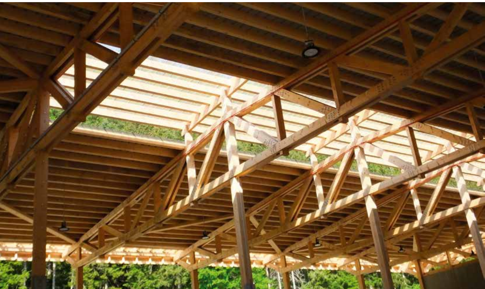
Quai de transfert Villard-de-Lans (38)

Le maître d'ouvrage exprime des attentes élevées en termes de développement durable. La prise en compte des objectifs de développement durable se traduira particulièrement, compte tenu de l'objet du marché, qui est la réalisation d'une construction, par l'emploi de matériaux de construction adaptés aux attentes. L'opération prévoit donc l'utilisation de bois bénéficiant d'une certification appropriée, notamment certifié BOIS DES ALPES , ou équivalent, car répondant à des exigences précises fondées sur les principes du développement durable dans ses composantes économique, sociale et environnementale.