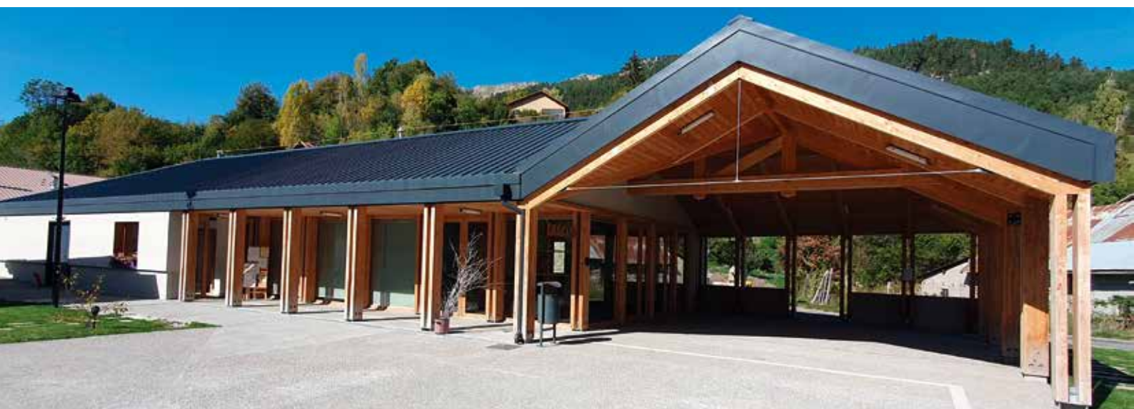
Salle multi-activités de Saint-Apollinaire (05)

En application de l'article 40 du CCAG Travaux, il comporte, au moins, les plans d'exécution conformes aux ouvrages exécutés établis par le titulaire, les notices de fonctionnement et les prescriptions de maintenance. Peuvent y être ajoutés, contractuellement ou en application de l'article 41.1 du CCAG Travaux, les fiches techniques des matériaux et produits mis en œuvre.