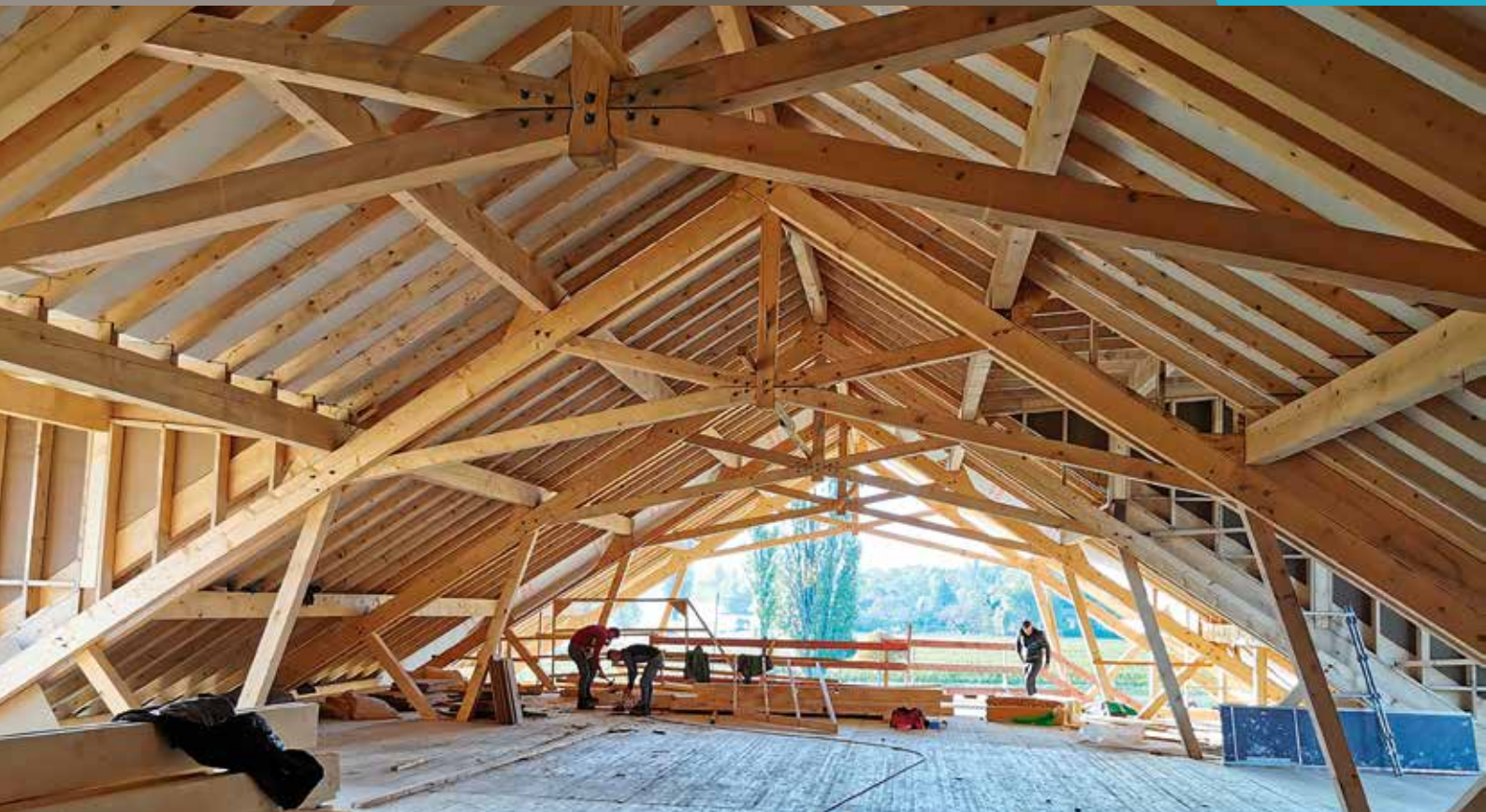
Maison de la vigne et du vin d'Apremont (73) - Crédit photo : Patey architectes