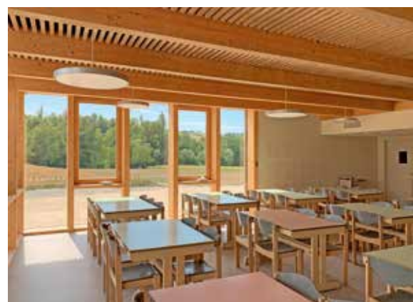
Groupe scolaire de Miribel (26)

Votre AMO et les Communes forestières pourront vous appuyer dans cette étape-clé.