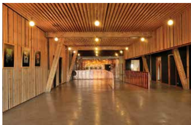
Maison de la vigne et du vin d'Apremont (73) - Crédit photo : Patey architectes

Des Fiches de Données Environnementales et Sanitaires (FDES) existent pour plusieurs produits en bois certifiés BOIS DES ALPES , elles sont disponibles sur www.boisdesalpes.net et peuvent être utilisées pour analyser les impacts environnementaux des matériaux comme demandé dans la Réglementation Environnementale 2020. (Cf page 5)